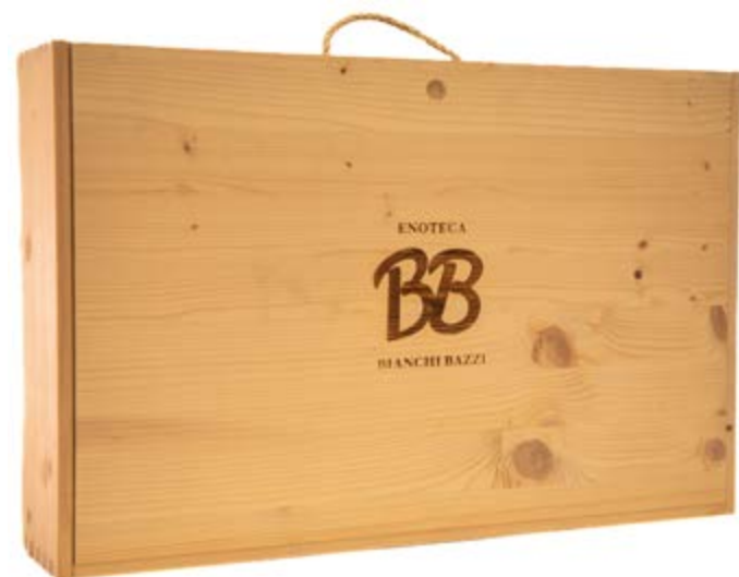
13 CANTINA LI DUNI Sardegna Confezione: Cassetta in legno da 6 bottiglie