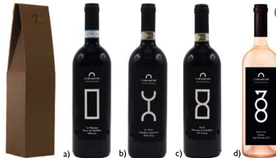
14 CA' BIANCHE Tirano (SO) Confezione: Scatola in cartone da 1 bottiglia a) La Malpaga Rosso di Valtellina DOC € 13,69 - € 16,70 IVA compresa b) La Tena Valtellina Superiore DOCG € 18,36 - € 22,40 IVA compresa c) Fasèt Sforzato di Valtellina DOCG € 28,93 - € 35,30 IVA compresa d) Settecento Rosato Alpi Retiche IGT € 15,08 - € 18,40 IVA compresa